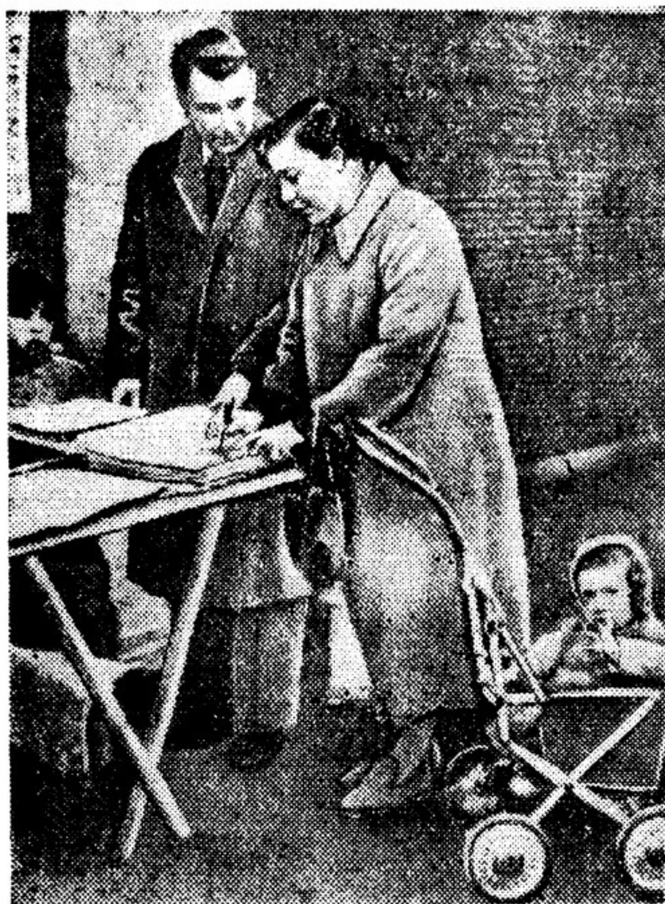
14 февраля многие жители 20-го округа Парижа подписали под письмом, адресованным министру иностранных дел Франции Жоржу Бидо и содержащим требование принять предложения министра иностранных дел СССР В. М. Молотова, сделанные на Берлинском совещании, о заключении Общевосточного договора о коллективной безопасности. На фото: на углу улиц Паран и Аманде парижанка подписывает письмо Жоржу Бидо.

На Берлинском совещании были сделаны предложения, которые могли бы способствовать принятию демократических решений и предотвратить какие бы то ни было возрождение германского милитаризма. В интересах ослабления напряженности в международном положении и установления