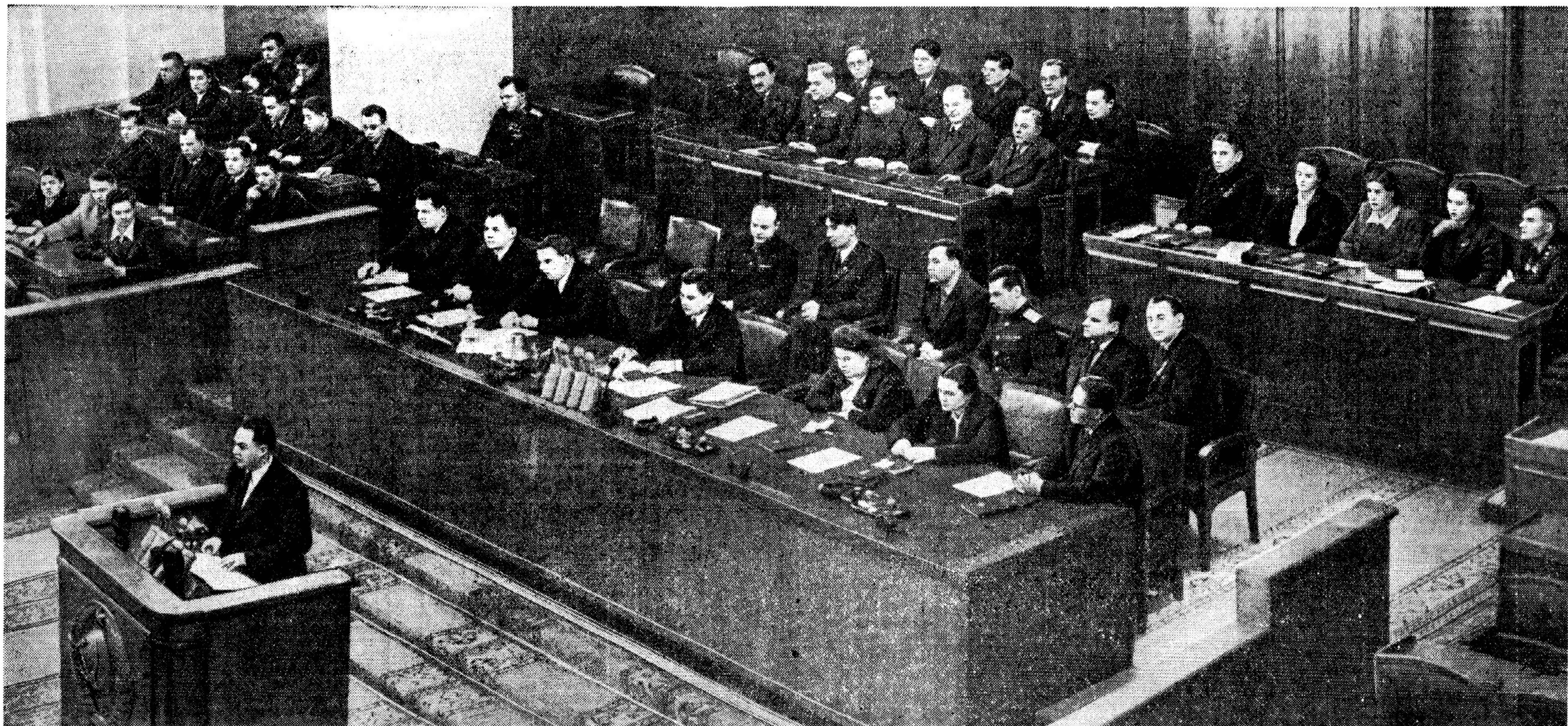
Президиум XII съезда Всесоюзного Ленинского Коммунистического Союза Молодежи. На трибуне секретарь ЦК ВЛКСМ А. Н. Шелепин.

А. Адалис. — Поэзия и мысль (3 стр.). Дневник искусств: Н. Игнатьева. — «Огни на реке»; К. Массалининов. — Хор в МТС (3 стр.). Б. Рюриков. — О богатстве искусства (3—4 стр.). Что говорят в Европе о коллективной безопасности (4 стр.). Мадлен Риффо. — Мир во Вьетнаме! — требуют простые французы (4 стр.).