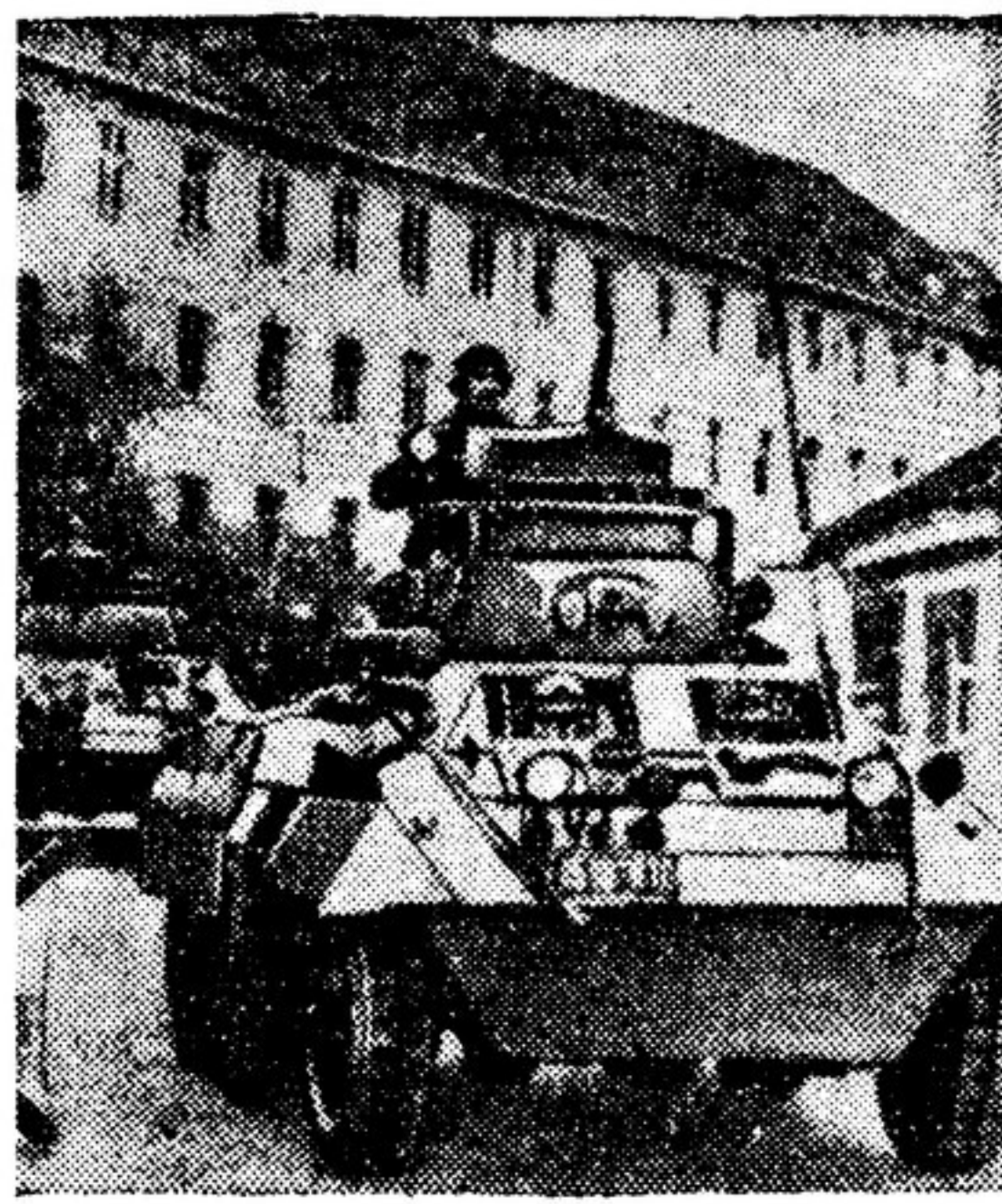
Вермахт возрождается! На фото: части адензурской федеральной пограничной охраны отправляются из казарм в западногерманском городе Эшверге на маневры.